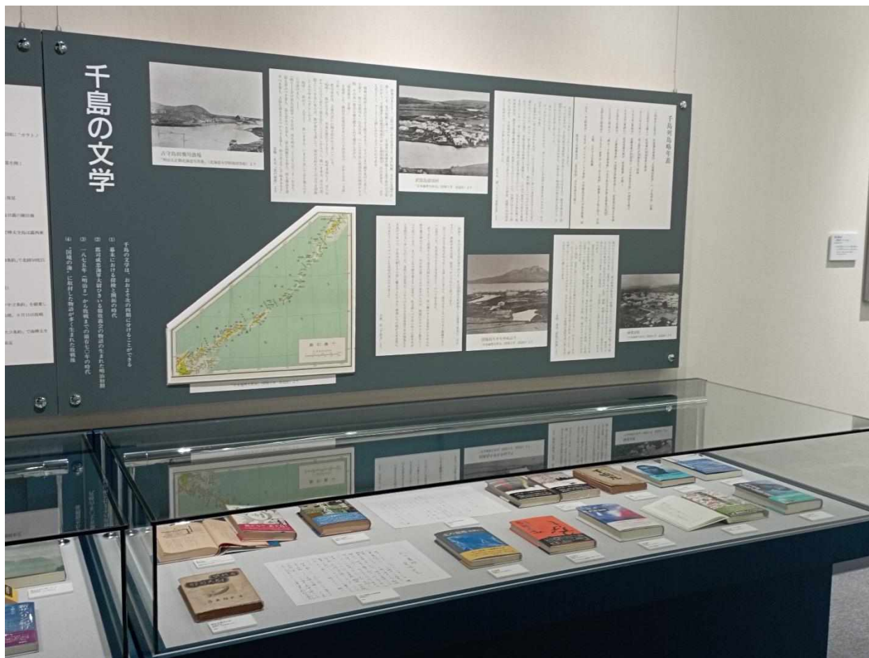
V. Литературната карта на остров Хоккайдо според експозицията на музея.