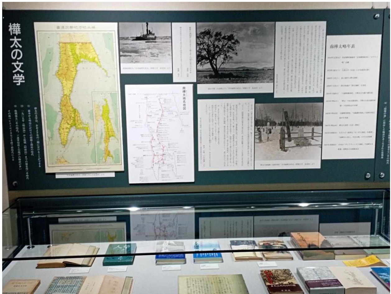
9. Литература от Курилските острови.